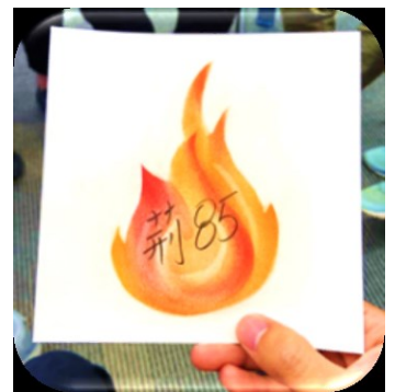
一名隊員深宵製作的和諧粉彩感謝卡

另外，很值得感恩的是，我在營會裏認識了一班志同道合的弟兄姊妹，大家都希望藉着成為少年軍導師，與青年人同行成長。這班準導師很多都是剛出來社會工作的年輕人，他們面對進入職場的適應，逐漸增多工作壓力，以及作息時間的挑戰。很深刻其中一位組員分享，他星期六、日都在教會服侍，確實失去一些獨處休息的時間。我相信這位組員的難處也是很多職青信徒所面對的，然後這位組員繼續分享，他仍然會堅持服侍這班青少年，是因為他相信這個群體是神給他的託付，所以每當他看到年青人的成長，看到神的工作時，他會感受到很大的滿足。我聽完之後很感受到他對神的委身以及他對教會群體的愛，當我們選擇事奉神，服侍弟兄姊妹，就一定會面對各方面的張力，因為事奉總是要花時間和心力，甚至有時候這些付出是沒回報的，內容可能是吃力不討好的，但我們真的要帶著神給我們的託付和異象，服侍教會，服侍弟兄姊妹。願神在大埔堂興起更多願意委身服侍的年輕信徒！